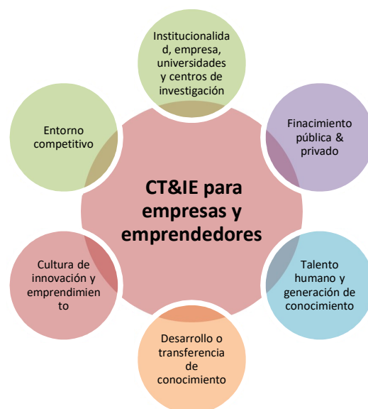
Figura 1. Pilares fundamentales para emprendimientos dinámicos en el país, acompañados de una política pública que ayude a gestionarlos a partir de Gómez y Mitchell (2014)

Nota. Elaboración propia con base en Gómez y Mitchell (2014)